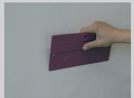
Vaporex Dampfsperre über dem PA2-Aluband auf Stoss verkleben